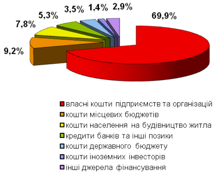
Рис. 2.1. Структура основних джерел інвестування в Україні у 2017 р.